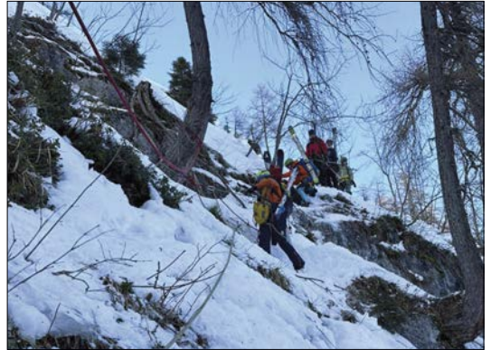
Größere Übung im Bereich des Grubhörndls

Neuerdings wurde landesweit eine neue Alarmierungssoftware für alle ehrenamtlich tätigen Bergrettungskameraden eingeführt. Mit der sog. “Mops” ist nun eine noch stabilere Einsatzapp in Gebrauch, um jeder-