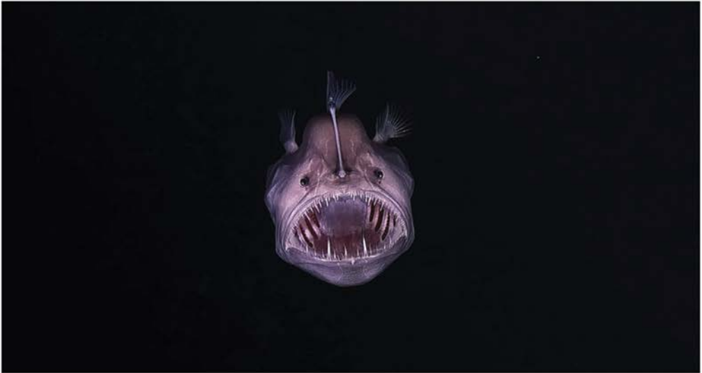
Ein Anglerfisch in 2.500 m Tiefe

WISSENSCHAFT FÜR ALLE Akademie in den Bundesländern