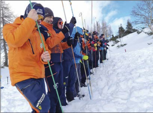
Lawinenschulung im Loferer Hochtal

Als Highlight wurde diesen Winter eine größere Übung im Bereich des Grubhörndls Ende Januar durchgeführt. Hier wurde die winterliche Bergung im alpinen Gelände sowie praktische Lawinenkunde im Stationsbetrieb trainiert.